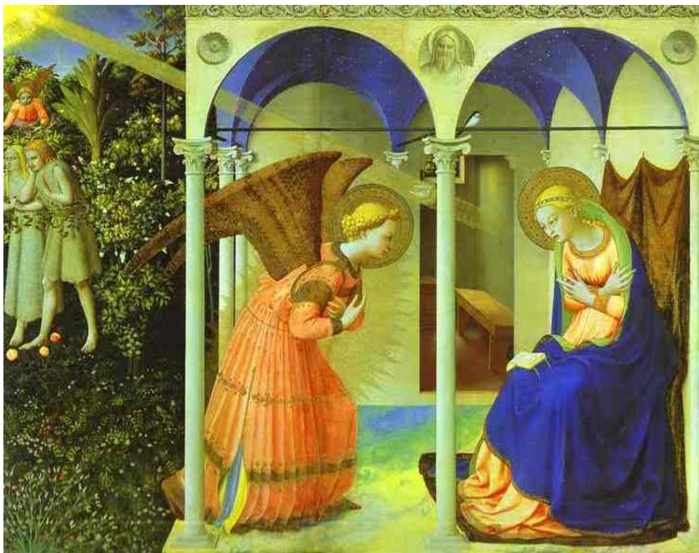
Fran Angelico, L'Annonciation , 1425, Musée du Prado.

Voici deux œuvres d'art qui représentent l'Annonciation à Marie. Nous vous proposons des commentaires glanés sur différents sites internet qui vous aideront à analyser et peut-être à vivre une méditation spirituelle à partir du récit à l'aide de ces grandes œuvres. Voilà une autre manière de grande valeur de se préparer et de nourrir sa vie spirituelle avant, pendant et même après la catéchèse!