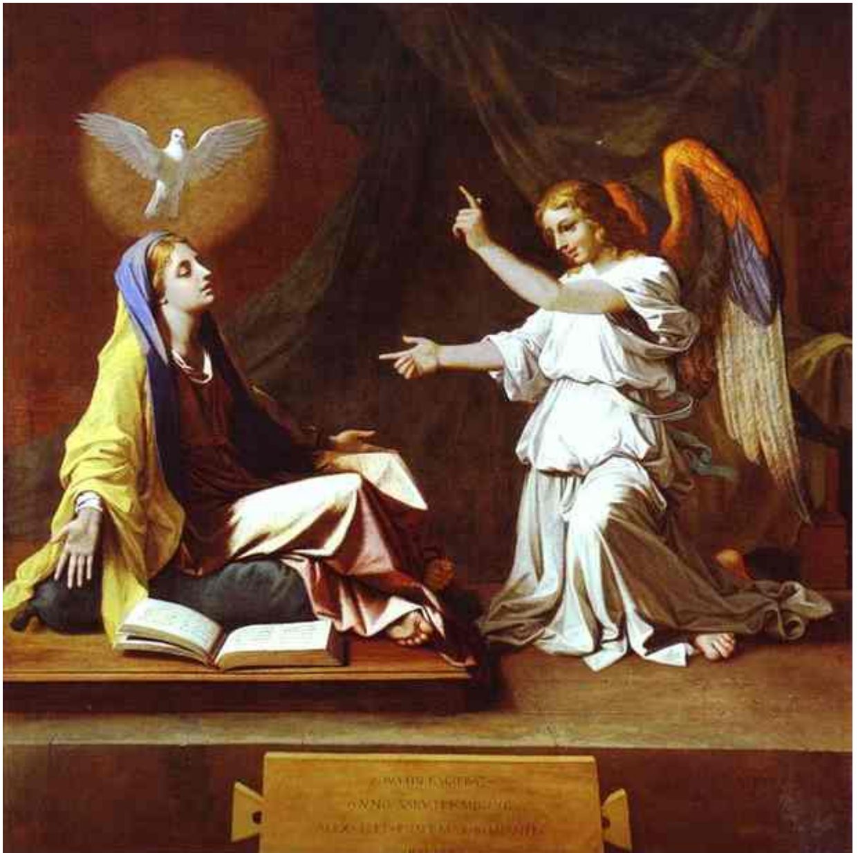
Nicolas POUSSIN, L'Annonciation , 1655. Londres, National Gallery.

« Cette Annonciation nous apparaît très simple, très pure : d'abord au niveau des éléments de son décor, laissant toute la place à la relation entre la Vierge, l'ange et l'Esprit Saint, qui participe au tableau comme un personnage à part entière.